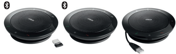
JABRA SPEAK™ 510+ UC

Profitieren Sie von der vollen Kompatibilität mit den führenden UC/Softphone-Lösungen und Bluetooth®-fähigen Mobiltelefonen, Smartphones oder Tablets – inklusive Call Control (Anrufsteuerung).